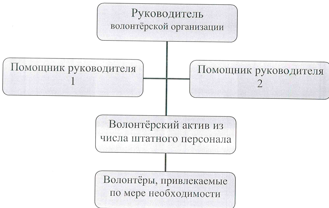
Рисунок 2. Пример схемы управления волонтерской организацией в ситуации проведения мероприятия